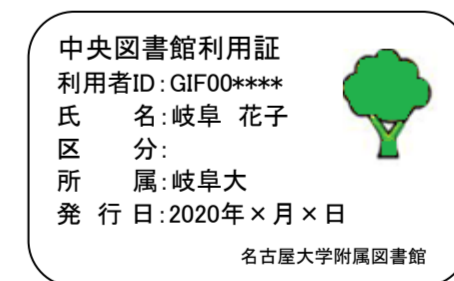
【岐阜大学学生・教職員カード】