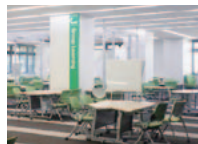
ラーニング・コモンズ

また、2階のディスカバリスクエア、3階のラーニングボッドは、予約をすることで、講習会・ゼミ・勉強会・プレゼンテーションの練習などのために占有利用できます（要学生証等）。