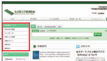
名古屋大学蔵書検索 OPAC