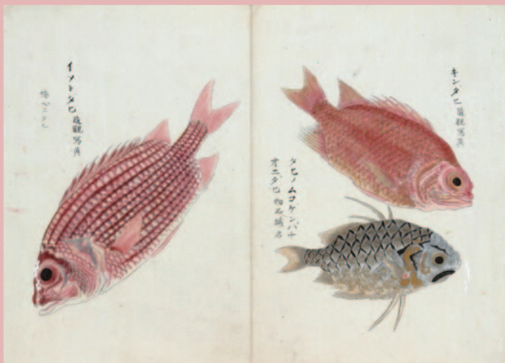
伊藤圭介文庫「錦築魚譜」より 「エビスダイ/マツカサウオ/イトウダイ」(名古屋大学附属図書館所蔵)