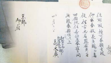
明治3年(1870)高木家の旧領地住居願書・許可書