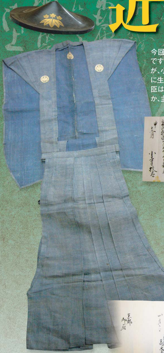
小寺家所用・高木家臣時代の装い

今回が初公開となる小寺家文書は、旗本高木家の家臣方に伝来した約8500点にのぼる古文書です。附属図書館所蔵の高木家伝来の古文書は、全国有数の武家文書として知られていますが、小寺家文書は、家臣の側から高木家文書の新たな内容を引き出す手がかりとして、また、在地に生きた旗本家臣の具体像を知り得る手がかりとして、きわめて貴重です。小寺家などの高木家臣は、どのように独自の生活を営みながら、主君に仕え、明治維新という激動の時代を迎えたのか、主従それぞれが蓄積してきた古文書を読み解きます。