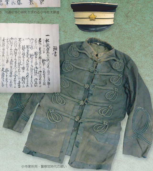
小寺家所用・警察官時代の装い

2009年5月11日(月) → 6月5日(金) 9:30~17:00 (日曜日は閉室)