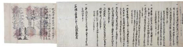
宝暦4(1754)年2月15日付 起請文