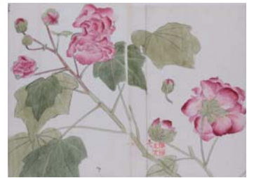
『錦窠植物図説』より

日本における近代植物学の祖といわれる伊藤圭介の稿本188冊を集めたもの。 『錦窠植物図説』『錦窠魚譜』『錦窠蟲譜』などの図譜のほか, 『採草叢書』などがある。